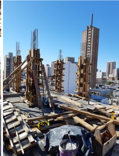
Estructura y Mampostería